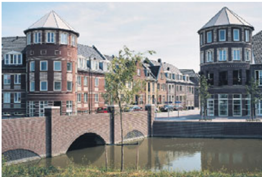
De Citadel lijkt op een oude vestingstad en heeft slechts twee toegangswegen voor autoverkeer.

Het Ruimtelijk Planbureau concludeerde eind vorig jaar dat de populariteit van 'wooncomplexen met een besloten karakter' in Nederland sterk toeneemt. Volgens de onderzoekers van het Planbureau zijn de Nederlandse gated communities vriendelijker dan de hekkwijken in Zuid-Afrika, Brazilië en de Verenigde